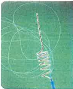
口紅直線科員のメルシーです