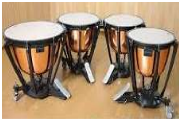
革張ティンパニ 2022年1月 配備