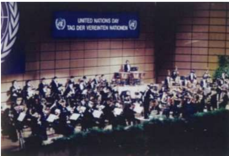
1991年10月25日 ウィーンでの初の海外公演