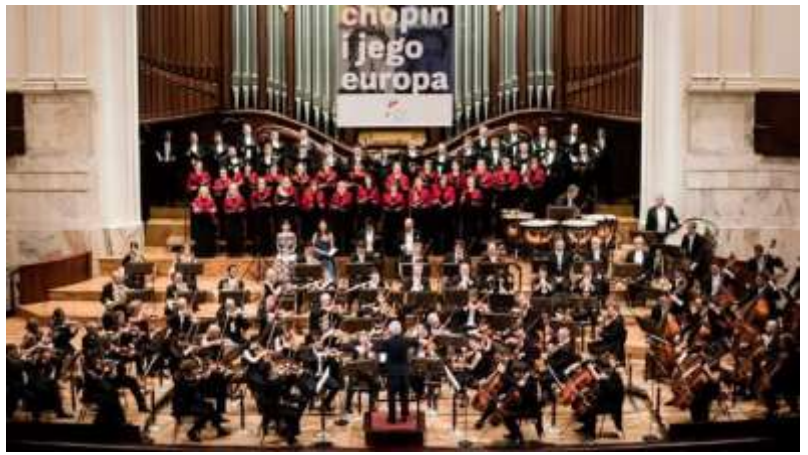
2019年8月17,18日 ポーランド・ワルシャワへの楽団員の派遣公演