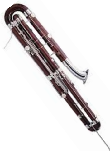
コントラファゴット