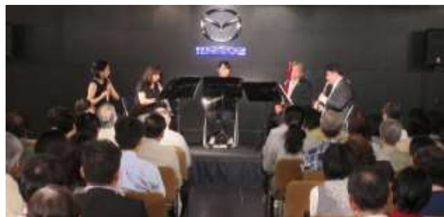
ロビーコンサート