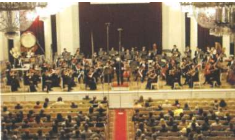
2003年10月17,18日 サントペテルブルグ公演