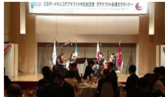
レセプションでの弦楽四重奏