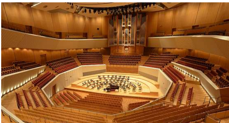
ミュージア川崎シンフォニーホール(川崎市)