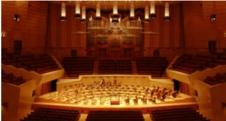
サントリーホール(東京都 港区)