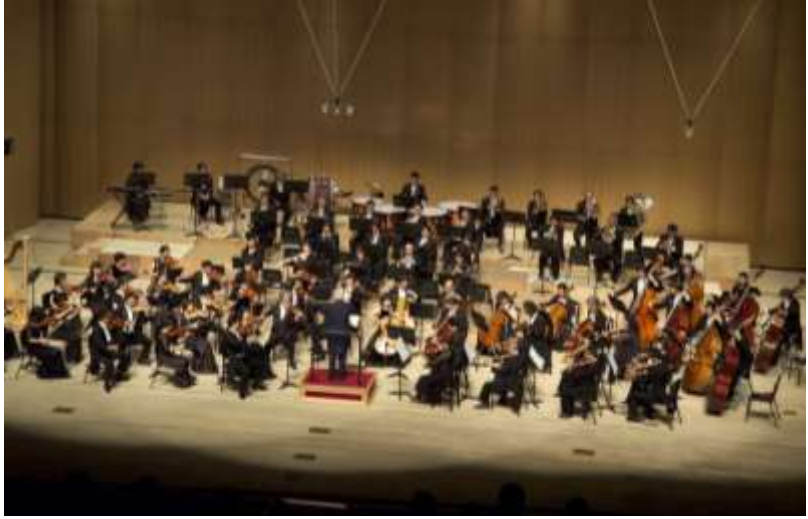
2005年10月19日 韓国公演(ソウル)