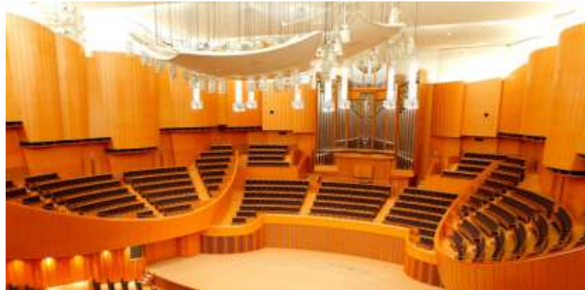
札幌コンサートホール Kitara(札幌市)

コンサートホールも楽器の1つとされています。国際平和文化都市にふさわしく、県民・市民の皆様から誇りとされる交響曲専用ホールの整備が望まれます。