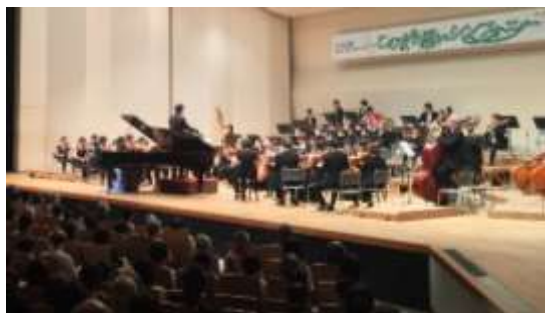
ホールでの演奏会