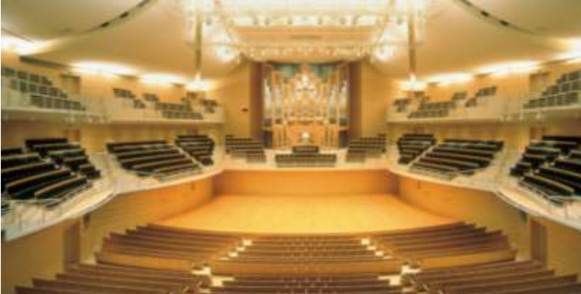
新潟市民芸術文化会館 りゅーとぴあ(新潟市)